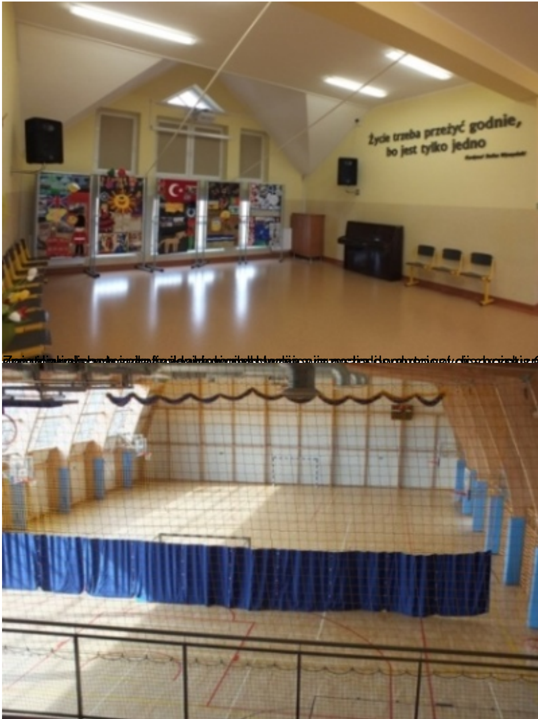
Wzrost i rozwój dziecka - warunki i środowisko