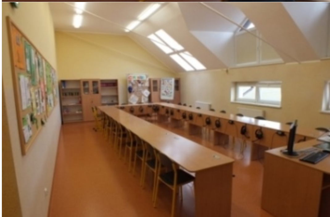
Wypisane dane dotyczące wyposażenia sali dla Klasy 5. p. Ważne jest zapisać iść słowami, a nie mawiając